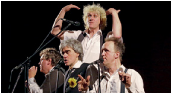
Herr Stumpfes Zieh & Zupf Kapelle